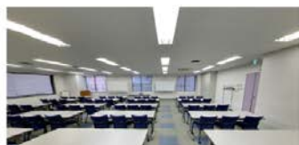
3L 大会議室 (125 ㎡) ■3 名掛: 72 名 ■2 名掛: 48 名