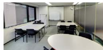
3 階ミーティングルーム (21 ㎡) ■2 名掛: 8～10 名

お問合せはこちらまで。お気軽にお電話ください。 お申込みはホームページからお願いいたします。