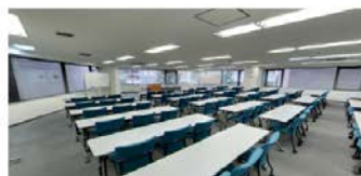
2 階 LL 大会議室 (155 ㎡) ■3 名掛: 108 名 ■2 名掛: 72 名