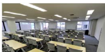
5 階 LL 会議室 (155 ㎡) ■3 名掛: 108 名 ■2 名掛: 72 名