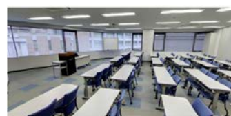
4 階 XL 会議室 (170 ㎡) ■3 名掛: 100 名 ■2 名掛: 76 名