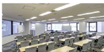
5 階 L 会議室 (125 ㎡) ■3 名掛: 72 名 ■2 名掛: 48 名