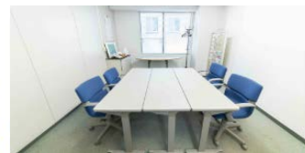
4階ミーティングルーム(19㎡) ■2名掛:8名