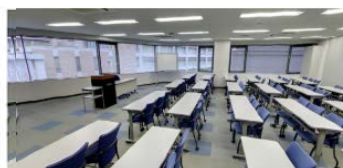
4階 XL 会議室(170㎡) ■3名掛:112名 ■2名掛:88名