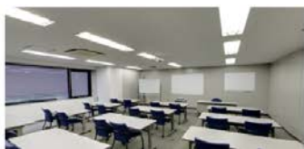
3階 S 会議室(55㎡) ■2名掛:24名